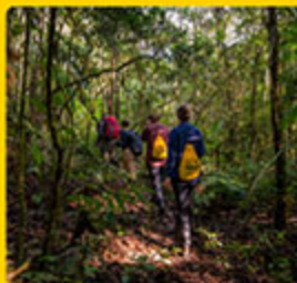
LEGADO DAS ÁGUAS