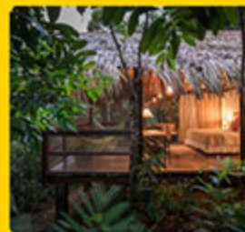
ANAVILHANAS JUNGLE LODGE

O ecoturismo é uma das frentes de atuação do Onçafari e você pode agendar passeios com a nossa equipe em 3 bases de atuação. Na Caiman Pantanal, realizamos safáris com foco em avistamento de onças-pintadas. Na Pousada Trijunção (Cerrado), realizamos safáris com foco em avistamento de lobos-guarás. No Legado das Águas (Mata Atlântica), realizamos trilha imersiva na floresta e caiaque noturno.